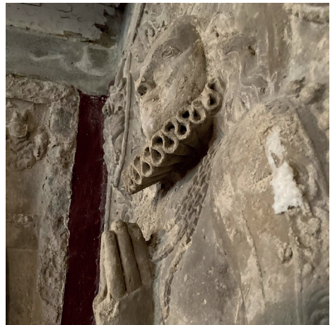
Epitaph in St. Marien Dedeleben

Die Freude an dieser ersten Himmel-Rad-Fahrt war groß. Viele haben erlebt, wie gut sich Bewegung, Gemeinschaft, Kirchen, Dörfer und geistliche Impulse verbinden lassen. Darum steht schon jetzt fest: Im nächsten Jahr soll es eine Fortsetzung geben — dann durch andere Orte des Pfarrbereichs zwischen Huy und Bruch.