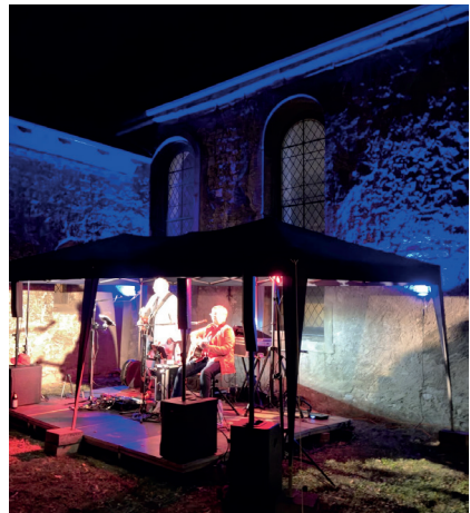
Livemusik durch Duo 90 Grad

Aufgrund der überwältigenden Resonanz (Zitat eines Gastes: „Es war gestern ein wundervoller und stimmungsvoller Abend. Das haben alle gesagt! Danke, dass ihr das so