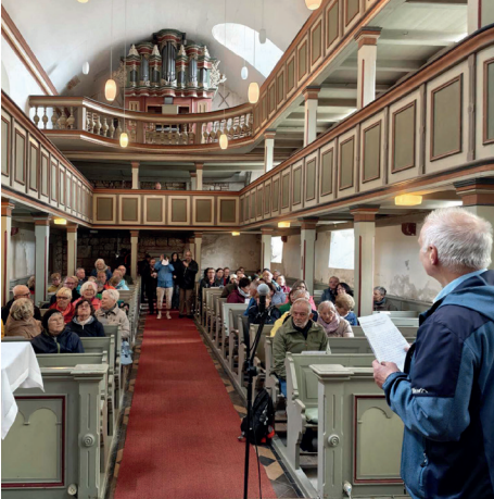
Andacht in der Kirche in Dedeleben