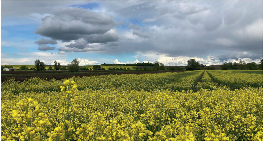
Das Wetter: kühl, aber trocken