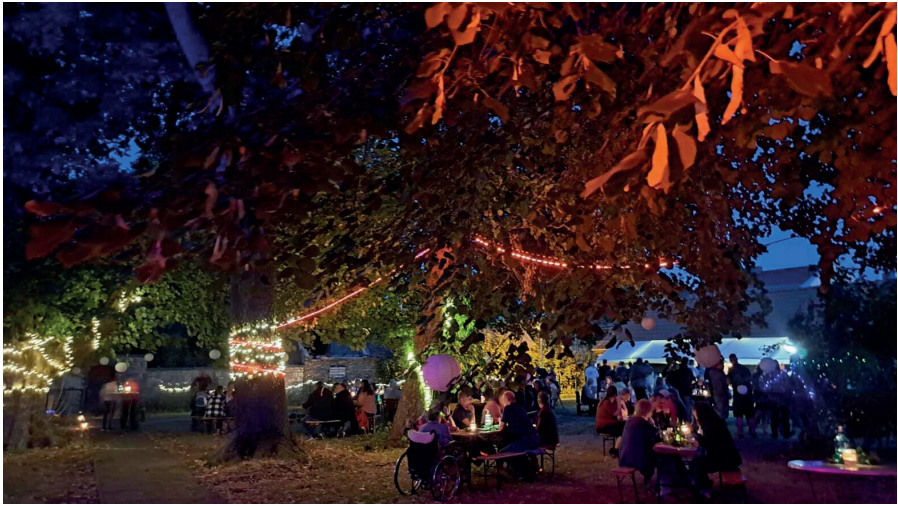
Das liebevoll geschmückte Außengelände

Im April 2025 gründeten wir unsere Kirchenprojektgruppe, um mit verschiedenen Aktionen/ Veranstaltungen unsere Marienkirche in der Gemeinde wieder sichtbarer zu machen was auch Ihrem Erhalt zu Gute kommt. So wurde im August 2025 „Die 1. Dedelebener Kirchenkneipe“ ins Leben gerufen.